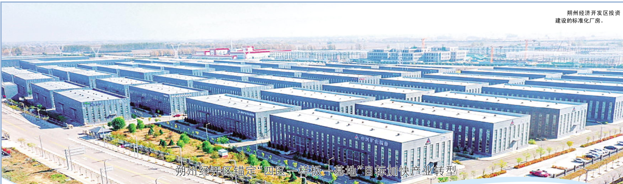
朔州经济开发区投资建设的标准化厂房。