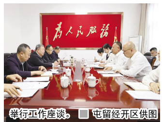
举行工作座谈。