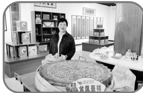
神池月饼产业助推经济发展。