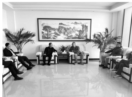
双方开展座谈交流