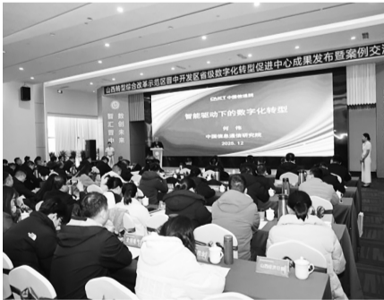
会议现场。