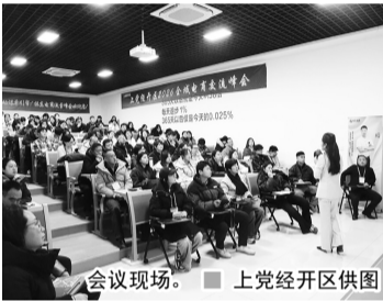
会议现场。 ■ 上党经开区供图

科学导报讯 1月13日,由上党经开区管委会与振东集团电商直播基地联合主办的“2026 全域电商交流峰会”在振东健康电商楼成功举办。本次峰会特邀行业资深专家授课,为广大企业、商家及电商从业者奉上了一场干货满满的实战盛宴。 峰会现场氛围热烈,干货满满。授课导师结合丰富的实战案例,深入浅出拆解电商运营技巧,从思维认知到实操执行层层递进,帮助参会者快速掌握从0到1起号变现的系统方法。互动环节中,导师针对参会者提出的账号定位、内容创作、流量获取等问题进行一对一答疑,精准解决实际运营难题。此外,参会人员还实地参观了振东电商直播基地,直观感受专业直播场景搭建与运营模式,进一步拓宽了电商发展思路。 据了解,本次峰会自1月8日启动报名以来,得到了上党经开区及周边市县企业、商家和电商从业者的积极响应,报名踊跃、参与热情高涨。活动还获得了长治市中药材产业发展中心、长治市中医药发展协会的大力支持。 活动的成功举办,不仅为电商生态各方主体搭建了高效的学习交流平台,更彰显了上党经开区聚焦产业发展、优化营商环境的坚定决心。下一步,上党经开区将持续围绕数字经济与实体经济深度融合,推出更多针对性强、实用性高的产业赋能活动,不断完善电商产业生态,助力辖区企业突破发展瓶颈,为区域经济高质量发展注入新动能。 王洋