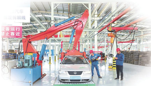
山西瑞赛格废弃资源综合利用有限公司小型汽车报废拆解线。

提到长治市眼下的营商环境,随处能听到这样的评价。好的营商环境是可以滋养经营主体成长的阳光雨露。今年以来,长治市坚持“市场化、法治化、国际化”要求,对标世行营商环境评估指标体系,推进营商环境升级版改革。以扩大“高效办成一件事”改革覆盖领域、推广涉企政策“一站式”综合服务、开展规范涉企执法专项行动等举措为引领,进一步激发经营主体活力,用优质营商环境凝聚起经济高质量发展的强大动力。