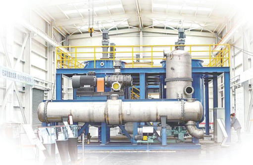
山西卓联锐科中试基地有限公司结晶高端装备制造项目即将进入试运行阶段。

襄垣县“源网荷储”一体化项目,是我省首批县级“源网荷储”一体化示范项目,总投资129.47亿元。项目建成后,可实现襄垣经开区绿电占比50%以上。 项目在推进过程中,企业遭遇资金瓶颈。了解情况后,中国工商银行股份有限公司长治分行迅速组建项目融资服务团队,了解资金到位、项目建设进度等情况,与企业达成合作意向。不到一周时间,项目贷款资料收集、报审工作已全部完成。 为破解企业发展资金难题、激发市场主体活力,今年2月,金融服务长治高质量发展“早春行”座谈会召开,17家金融机构与长治市24家企业签订了授信或贷款协议,总金额119.5亿元,涉及新能源、新材料、信息技术、高端装备制造和商业服务等多个领域。今年3月,在长治高质量发展“早春行”商务专场活动现场,8家金融机构与9家企业成功“牵手”,28.88亿元信贷协议落地,涉及新材料、现代物流、高端装备制造等多个领域。在各县区政银企座谈会上,襄垣县银企现场签约5.69亿元,壶关县9家银行与9家企业代表