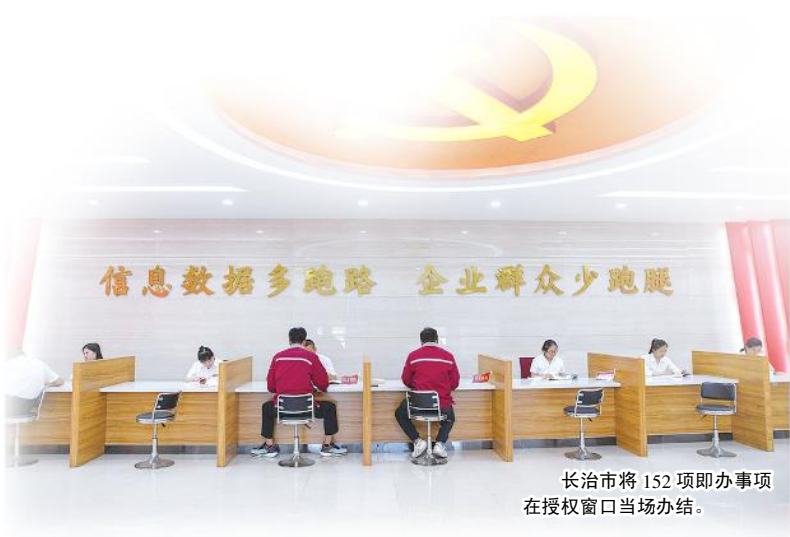
长治市将152项即办事项在授权窗口当场办结。

共受理12345热线转办企业诉求104件,办结率达100%,满意率95%。同时,通过“长清班”等培训项目,搭建高层次学习交流平台,提升民营企业综合素质,构建亲清政商关系。 与此同时,市农业农村部门围绕全市乡村产业振兴目标,从政策、资金、项目、人才、服务等方面“出招落子”,推动惠农、惠企政策精准落地,大力扶持培育新型农业经营主体,着力打造特色农业全产业链,推动全市特优农业高质量发展。市商务部门通过政策活动双轮驱动、消费场景提档升级、加力扩围以旧换新、数字消费赋能增效等举措,扶持培育新型商贸经营主体,确保各项惠企政策落实落地,引导经营主体用好用足政策,从而助力经济高质量发展。 同步开展的还有全市规范涉企行政执法专项行动,分五组深入12个县区和11个重点领域指导调研,全方位、深层次排查涉企行政执法领域存在的问题。以制度建设为引领、以信息公开为抓手,以主体管理为支撑,切实减少对企业正常生产经营的不必要干扰。全面提升涉企行政执法的规范化水平,为全市经营主体的培育营造良好氛围。 当制度支撑更坚实,政务服务更温暖,法治保障更有力,政商关系更清爽,长治市的万千经营主体必能如雨后春笋般拔节生长,为谱写中国式现代化长治篇章汇聚磅礴势能。常新/文