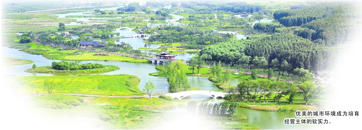
优美的城市环境成为培育经营主体的软实力。