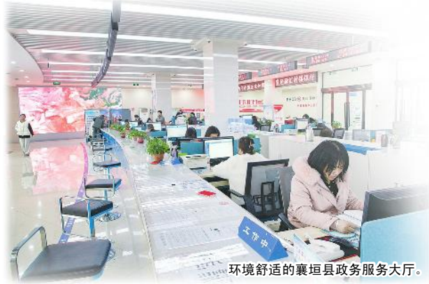
环境舒适的襄垣县政务服务大厅。