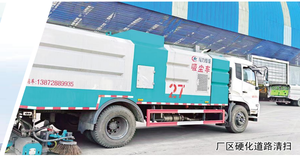
厂区硬化道路清扫