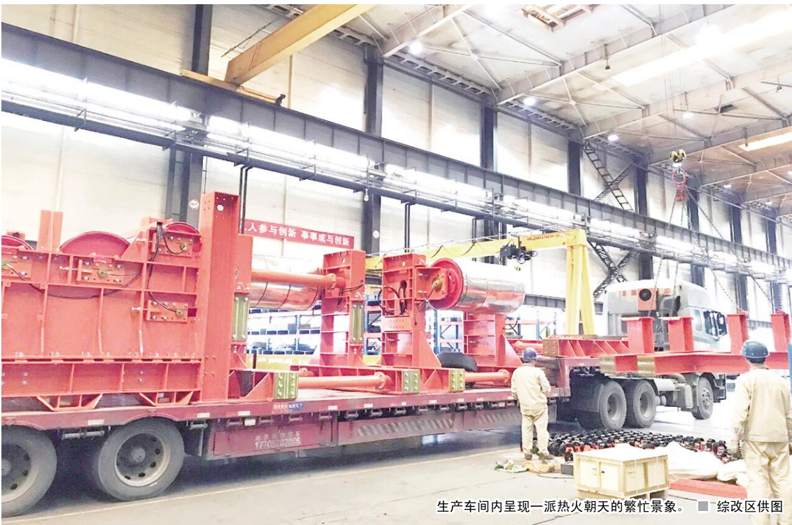
生产车间内呈现一派热火朝天的繁忙景象。