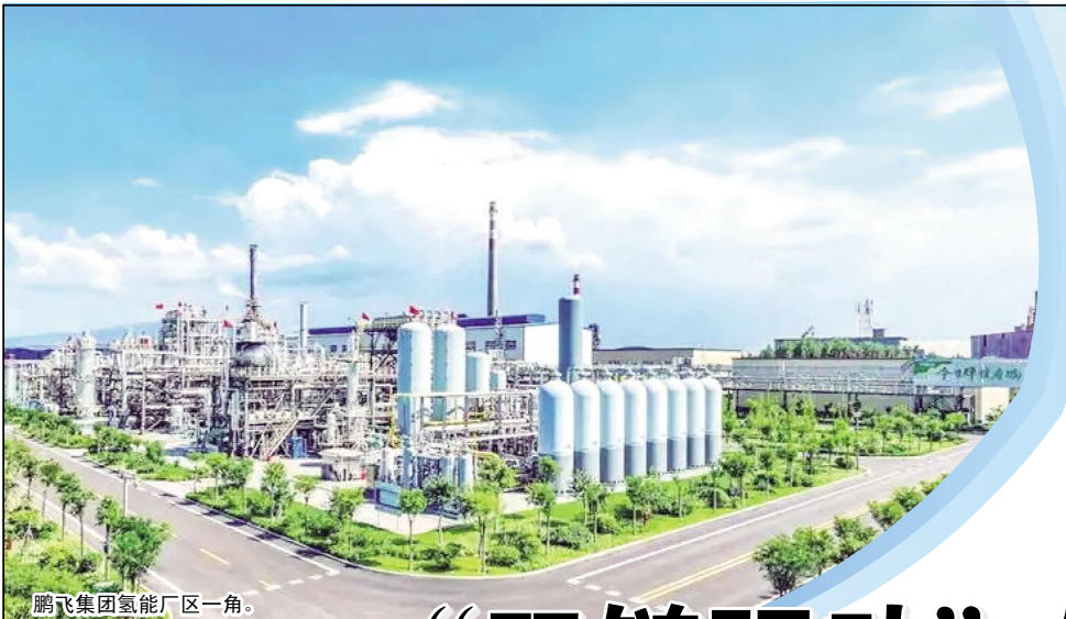
鹏飞集团氢能厂区一角。