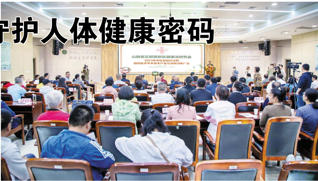
专家与媒体面对面现场