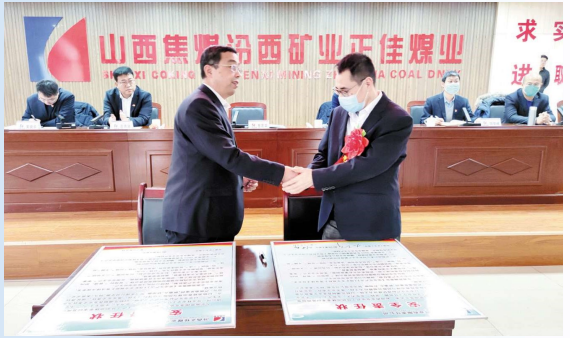
环保安责任状签订现场会