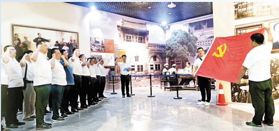
党员干部参观红色教育基地、重温入党誓词