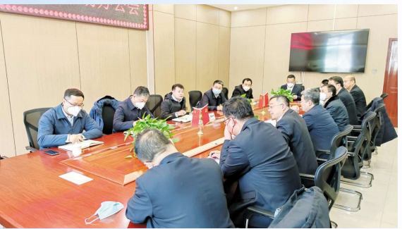
汾西矿业集团领导班子调研正佳煤业现场办公会