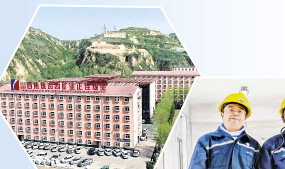
正佳煤业矿区全景