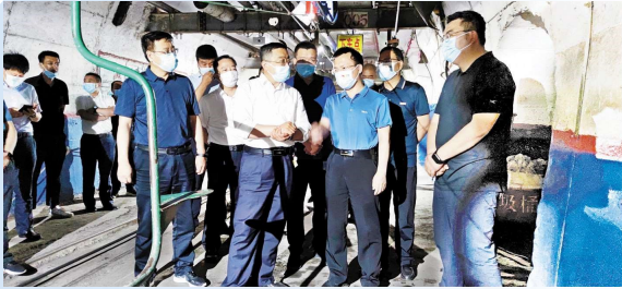
深入矿井调研指导安全生产工作

一系列举措理清了各级人员安全工作主要思路,实现了安全生产责任落实与安全管理的深度融合,大大提高了矿井系统保障能力和现场标准化管理水平。2020年以来,正佳煤业安全综合绩效考核优良,实现了安全生产无事故。